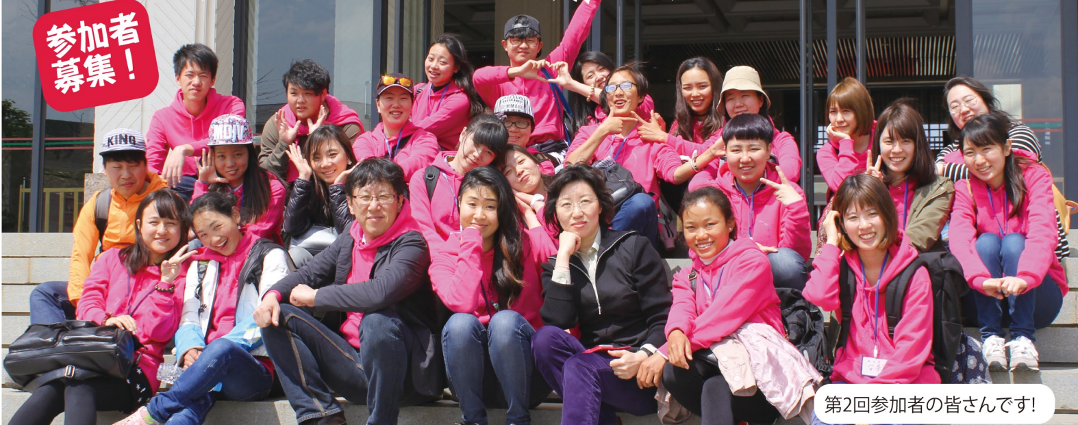
第2回参加者の皆さんです!

「アジアの未来へ貢献したい」と考えている大学生のあなた。今回3回目は、日本を舞台に雲南の大学生と共に社会問題を見て聞いて、楽しくそして沢山の交流を、通じて雲南や日本での社会貢献活動を活発にする方法と未来を考える国際交流ツアーです。